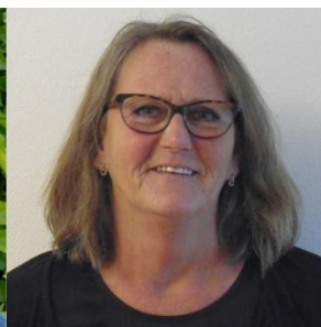
Lena D Larsson